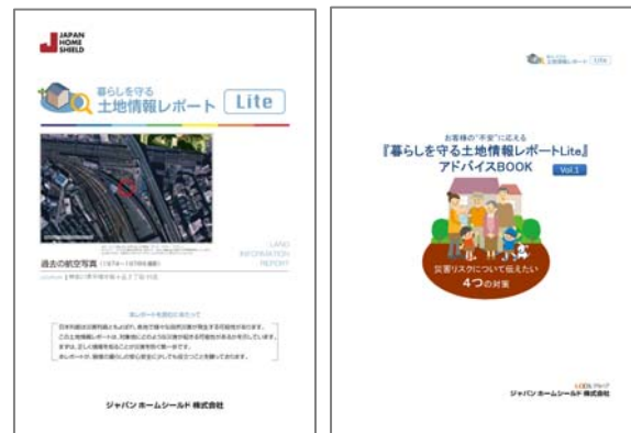
＜土地情報レポートLite・アドバイスブック＞

「土地情報レポート」は、自然災害時における土地の特性やリスクについて、専門機関のデータをまとめたサービスです。契約前に土地の情報を開示することで、耐震設計や防災対策のプレゼンテーションが可能になり、お客さまとの信頼関係を築けるツールとしてご好評をいただいています。また、これらの情報は、今月改正された住宅性能表示の「液状化に関する情報提供」や、今後改正が予想される民法の情報提供の動きにも対応できるなど、さらに活用の幅は広がっています。