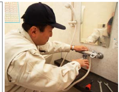
＜設備トラブル緊急サポート＞

今回の「地盤サポートシステムプラス」では、従来の地盤調査・解析、ならびに品質保証に加え、新たにお引渡し後の生活サポートをセットにした新サービスを提供します。