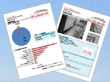
（イメージ）インスペクションレポート