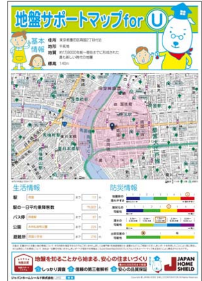
「地盤サポートマップ for U」のレポート

また、「地盤サポートマップ」および「地盤サポートマップ for U」がご好評をいただいていることから、2017年3月からは「地盤サポートマップ アプリ版」の提供もスタートしました。下記ページより登録不要・無料でご利用いただけます。