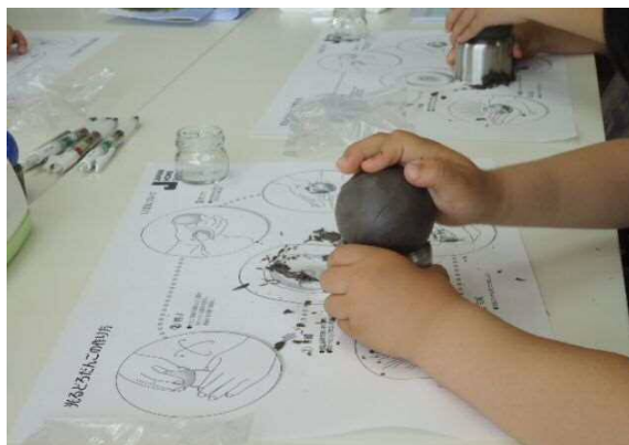
<作成している様子>

「土のふしぎ体験教室」は安全・安心な社会づくりに貢献することを目的とした当社のCSR活動の一環として実施しており、2018年5月現在でのべ3,800名以上が光るどろだんごを作成しています。