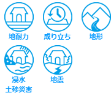
< 新アイコン >

近年大雨による大規模な水災害が頻発・激甚化しており、災害・気象情報の入手や安全な避難経路の確認など、日頃から身を守るための備えが強く求められています。今回の地盤サポートマップのリニューアルはそういった声に応え、国土交通省の「ハザードマップポータルサイト」と連動することで浸水リスク情報を常に最新情報にアップデートし、自分の住む地域の水害リスクを意識し、減災・防災に繋げることを目的としています。視認性・操作性向上を目的に「地耐力」「土地の成り立ち」「地形」「浸水・土砂災害」「地震」の5つのアイコンも新たに追加し、知りたい情報をワンクリックで確認することもできます。地盤サポートマップは全国各地の住宅地盤のリスク情報をカバーしていますが、各自治体のハザードマップも確認いただき、合わせてご利用いただくことでより具体的な防災活動になるものと考えます。